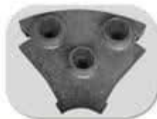
بغل بند روتور