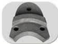
بغل بند درچه