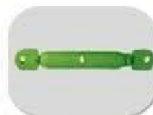
دو بیج رگلاژ