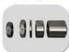
مهره کامل شافت