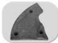
بغل بند سقف