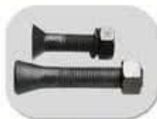
بیج و مهره های بغل بند