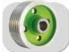
پولی سر شافت