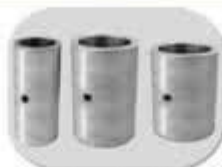
بوشهای پایه دینام