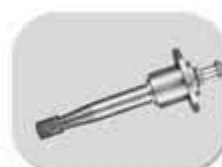
شافت و فلنج