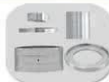
بوشهای رابط فلنج